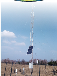
STACJA METEOROLOGICZNA W KARSKU str. 12