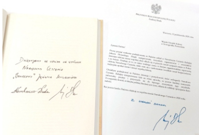
powyżej podziękowania od pary prezydenckiej